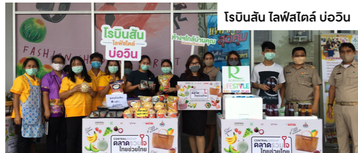
โรบินสัน ไลฟ์สไตล์ บ่อวิน