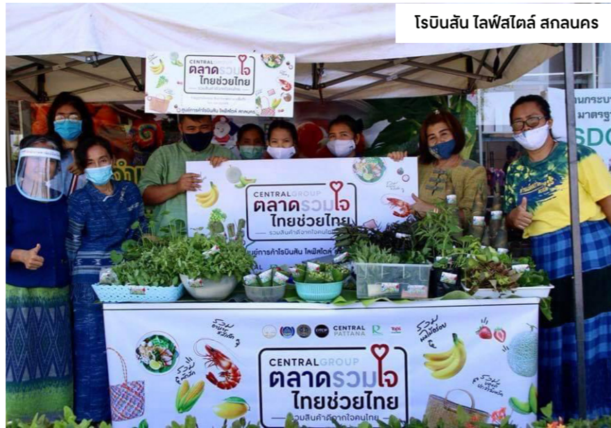
โรบินสัน ไลฟ์สไตล์ สกลนคร