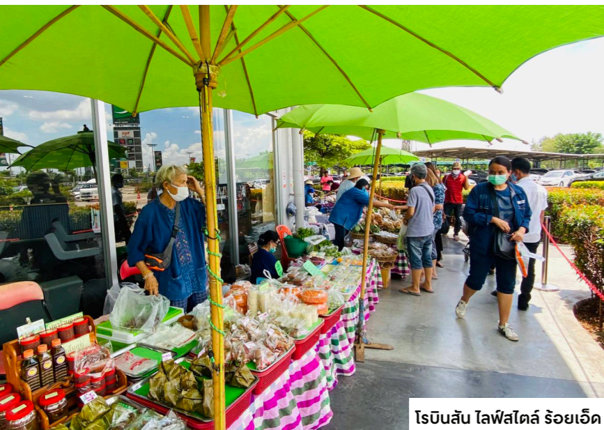
โรบินสัน ไลฟ์สไตล์ ร้อยเอ็ด