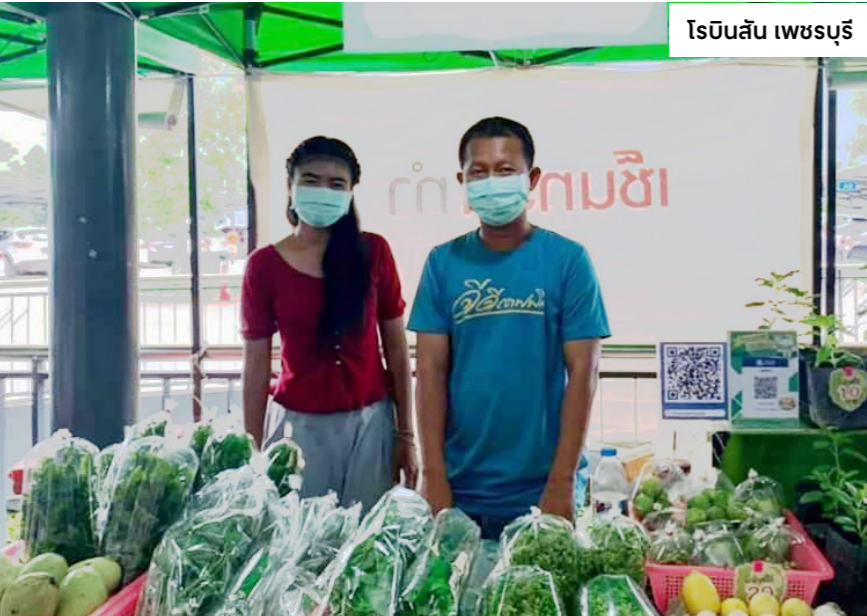
โรบินสัน เพชรบุรี

กลุ่มเซ็นทรัล สนับสนุนพื้นที่ขายฟรีในศูนย์การค้าและช่องทางออนไลน์ ให้กับเกษตรกรและผู้ประกอบการรายย่อย เพื่อให้ความช่วยเหลือผู้ได้รับผลกระทบจากสถานการณ์โควิด-19 และฟื้นฟูเศรษฐกิจประเทศไทย